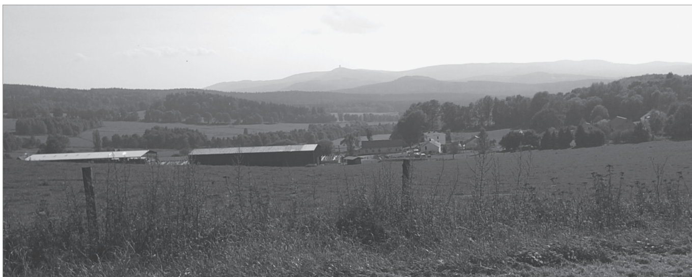
foto č. 9 – Pohled na Novou Ves – v pozadí Velký Zvon

/: Rozněvál sem sobě potěšení moje, nemůžem se hudobřit. :/