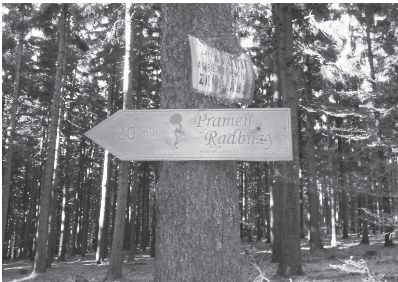
foto č. 10 – Cesta k pramenům je dobře značená